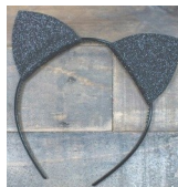
Patroon vir muisoortjies